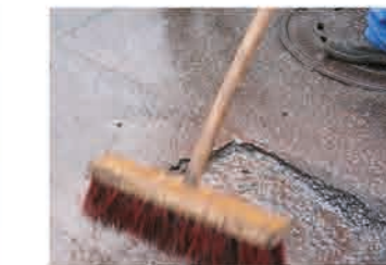
Kleine Fläche mit Handstampfer