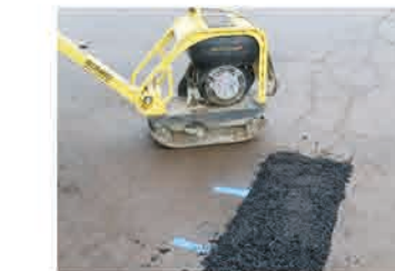
Größere Fläche mit Vibroplatte

kaugummi-asphalt® ist flexibel und in Zusammenhang mit einer Vielzahl von Oberflächen anwendbar. Nachfolgend finden Sie einige Beispiele, wie wir kaugummi-asphalt® erfolgreich verwendet haben: