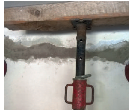
Unterstopfen eines Schlitzes in einer tragenden Wand mit PCI Repaflow USM.