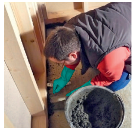
Unterstopfen von Holzrahmen mit PCI Repaflow USM, um einen kraftschlüssigen Verbund zur Bodenplatte herzustellen.