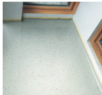
Durch Abstreuen mit Farbchips lassen sich Bodenflächen, z.B. auf Balkonen, mit PCI Pursol 1K dekorativ und individuell gestalten.