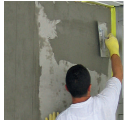
PCI Barrafill L für Kosmetikarbeiten an Betonbauteilen.