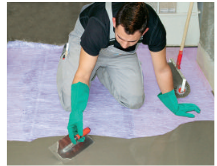
Die geeignete PCI Bodenausgleichsmasse wird auf der ausgelegten Glasfaserverstärkung PCI Armiermatte GFM ausgegossen und mit einer Spachtel verteilt (Mindestschichtdicke 5 mm).