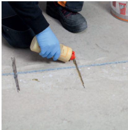
Etwas PCI Apogel® SH vorlegen.