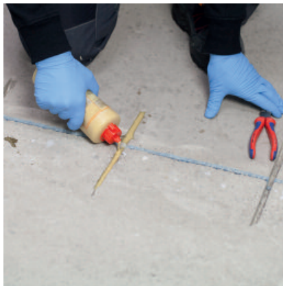
Die Nut oder Fuge komplett mit PCI Apogel® SH ausgießen.