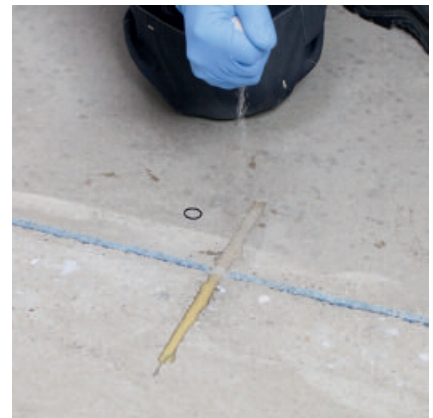
Oberfläche glatt abziehen und bei Bedarf mit Quarzand 0,3 - 0,8 mm voll deckend abstreuen.