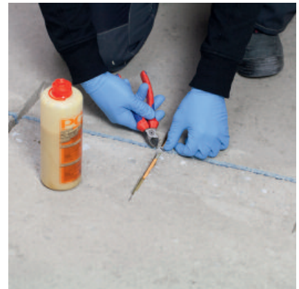
PCI Apogel® Dübel oder Estrichklammern in die Nut einlegen.