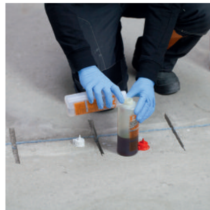
PCI Apogel ® SH kann einfach nach Mischen in der Flasche angewendet werden.