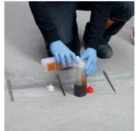
Wenn die zu vergießenden Fugen oder Nuten vorbereitet sind die beiden Komponenten von PCI Apogel® SH zusammenschütten.

Angemischtes Gießharz in die Risse/Fugen oberflächenbündig eingießen und Oberfläche glatt abziehen. Für einen besseren Verbund mit nachfolgenden Bodenausgleichsmassen/ Spachtelmassen und Klebstoffen sofort im Anschluss mit trockenem Quarzsand abstreuen. Feine Risse aufgrund der schnellen Erhärtung möglichst innerhalb kurzer Zeit nach dem Anmischen von PCI Apogel SH verfüllen. Bei breiteren Rissen/Fugen ist es besser das angemischte Gießharz in der Flasche kurze Zeit vorreagieren lassen, bis sich eine etwas dickflüssigere Konsistenz eingestellt hat.