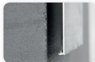
Galant - Blende mit definierter Abtropfkante.