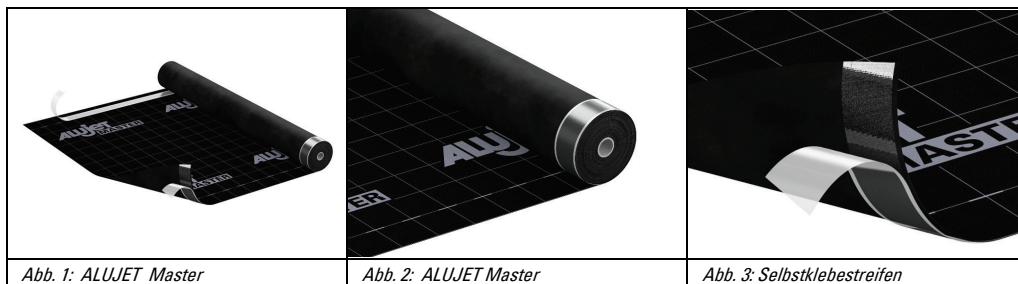
Abb. 1: ALUJET Master