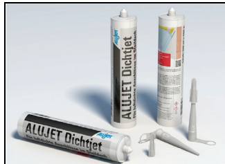
Abb. 1: ALUJET Dichtjet 310 ml