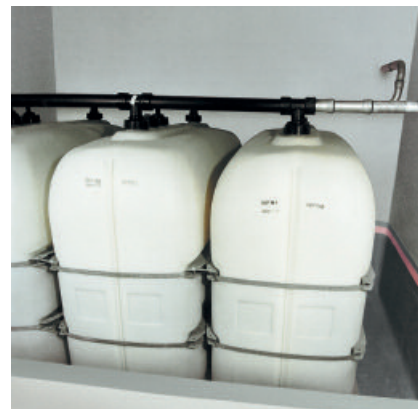
Heizöllageraum mit PCI Visconal-Schutzbeschichtung.

Putz- und Estrichflächen von Auffangwannen und -räumen für Heizöl EL und Trafoöle.