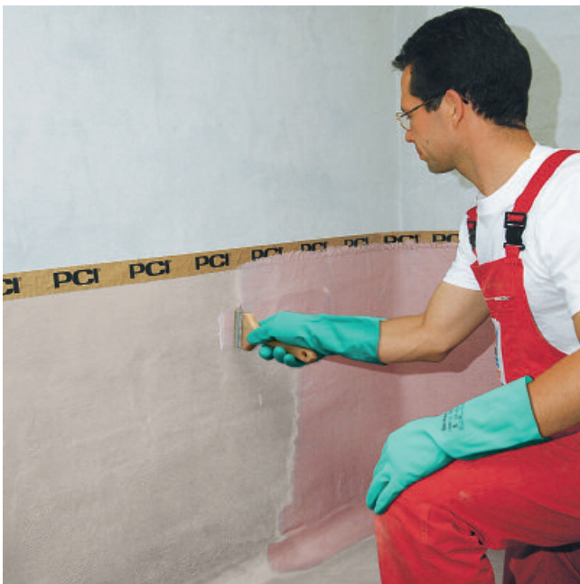
Auf die mit 50 % Wasser verdünnte PCI Visconal grundierte Fläche (grau) kann nach ca. 8 Stunden Trocknungszeit der erste Deckanstrich mit PCI Visconal (rot) aufgestrichen werden.