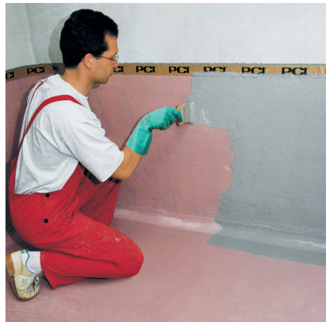
Da für eine öldichte Beschichtung mindestens eine Grundierung und zwei Deckanstriche erforderlich sind, ist nach weiteren ca. 8 Stunden Trocknungszeit der zweite Deckanstrich mit PCI Visconal (grau) aufzutragen.